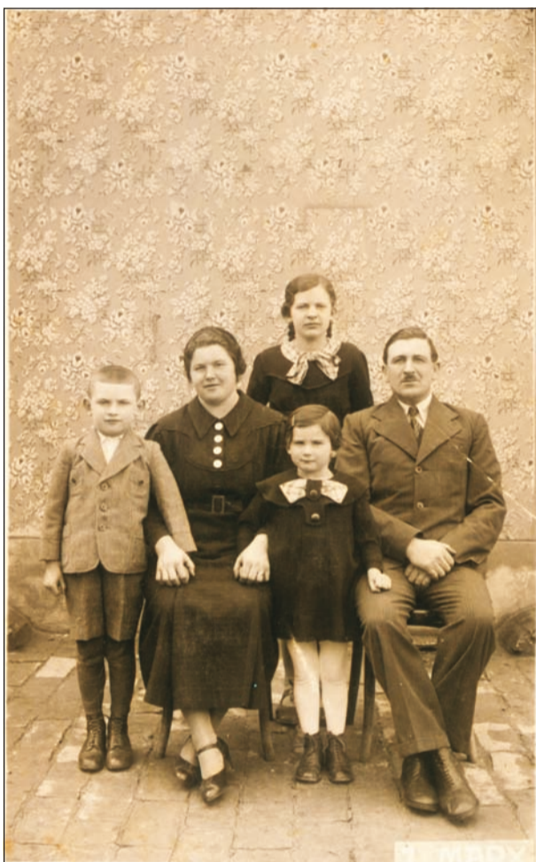
Mühlroth-Familienbild ausm Jahr 1935