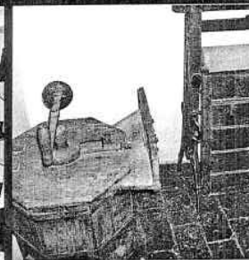
Mașină manuală de spălat rufe (stânga)